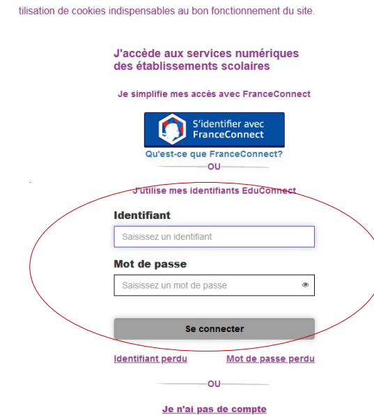
3. Entrer les identifiants