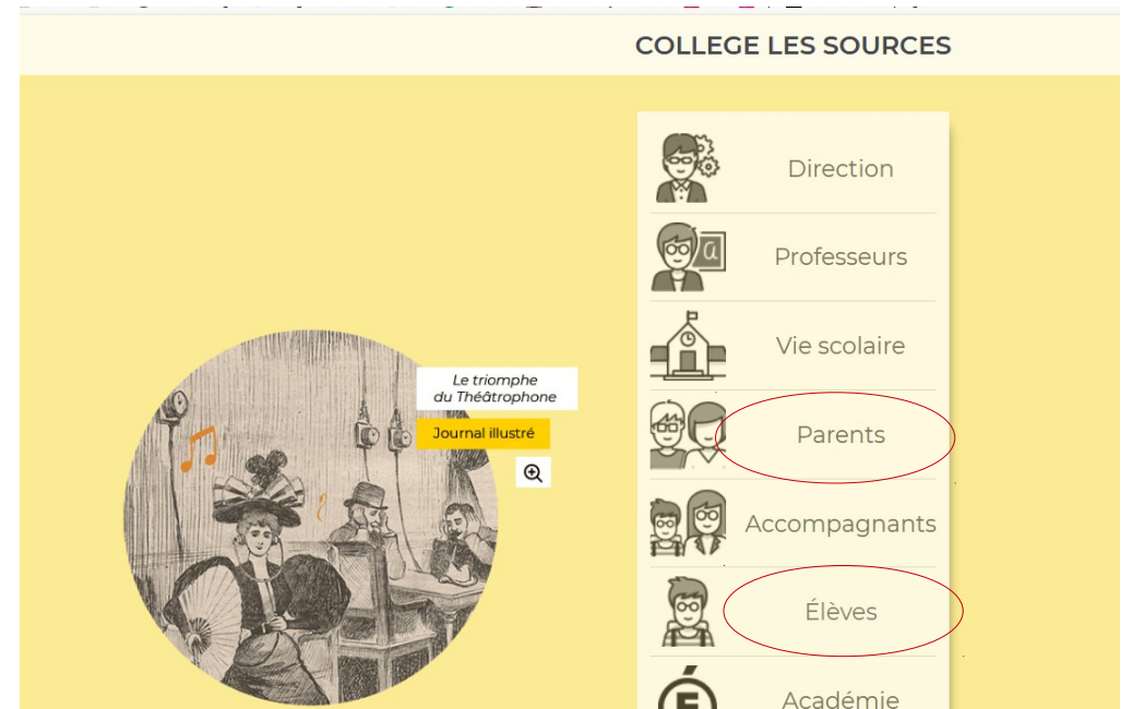
5. Entrer simplement en choisissant votre profil