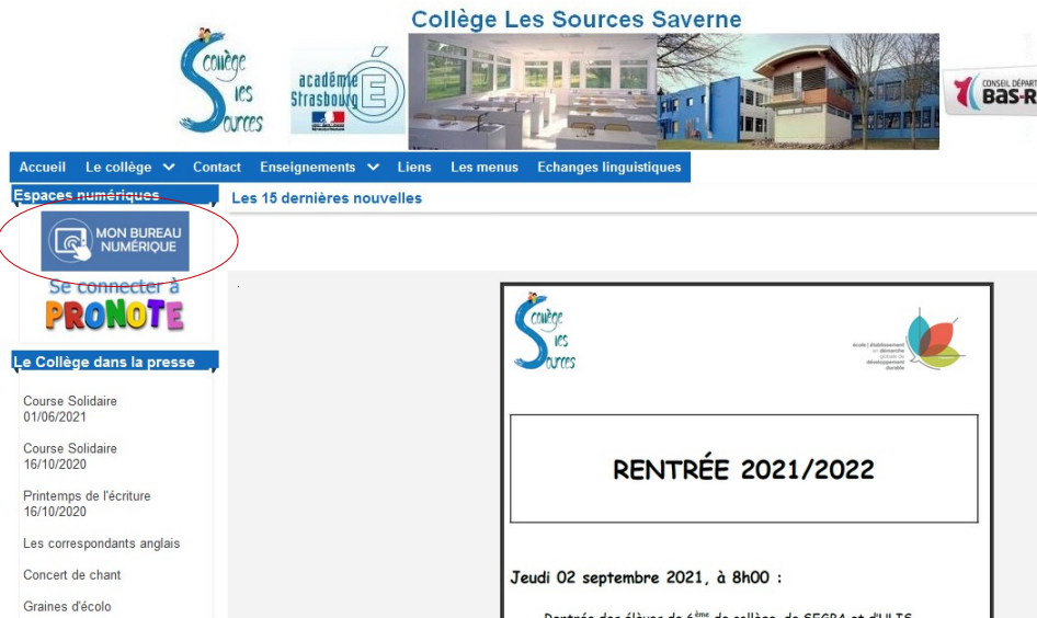
1. Depuis le site du collège des Sources Choisir Mon Bureau Numérique